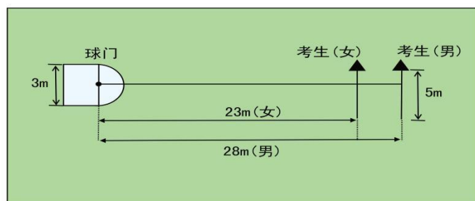
图 1 传准场地示意图

（1）考试方法：如图 1 所示，传球目标区域由一个室内五人制足球门（球门净宽度 3 米，净高度 2 米）和以球门线为直径（3 米）画的半圆组成，圆心（球门线中心点）至起点线垂直距离为男子 28 米，女子 23 米。考生须将球置于起点线上或线后（线长 5 米，宽 0.1 米），向目标区域连续传球 6 次，左右脚均可，脚法不限。